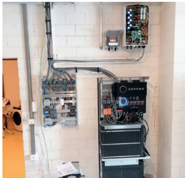
Photovoltaikanlage mit Speicher

Der Pikettdienst der EW Schmerikon AG wurde 58 mal gerufen, um kleinere und grössere Störungen zu beheben.