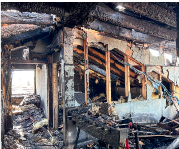
Dachwohnung nach Brand

2025 wurde der Sondernutzungsplan weiterentwickelt und der Kommission Städtebau sowie dem Tiefbauamt St. Gallen vorgestellt. Mit angrenzenden Eigentümern laufen noch Gespräche über einen Anschluss an den Sondernutzungsplan. Dieser ist wegen offener Abstimmungen und notwendiger Bereinigungen noch nicht fertiggestellt und zur Prüfung an den Kanton eingereicht. Die Ausgewogenheit zwischen innerer Verdichtung, Sondernutzungsplan und Ansprüchen aller Beteiligten bleibt eine zentrale Herausforderung.