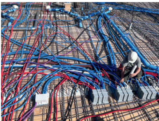
Rohrmontagen Neubau MFH Eschenbacherstrasse