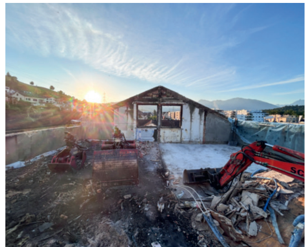
Räumung Dachgeschoss nach Brand