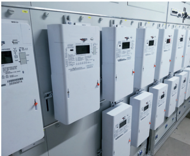
Neue Smart Meter.

Ablesung ist bei diesen Zählern nicht mehr nötig und auf Wunsch können ganze Verbraucherprofile ausgelesen werden.