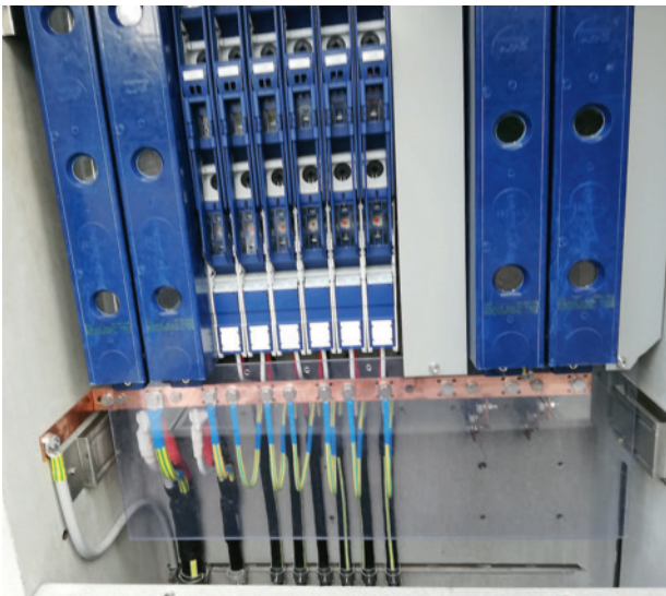
Neue Verteilkabine Breite.

Mittelspannungsschaltanlagen müssen im 5-Jahres-Turnus überprüft und gewartet werden. Diese Wartungen sind mit grossem Aufwand verbunden,