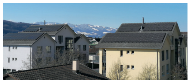
Seefeld Nord mit montierter Photovoltaikanlage.

Für die Baugesellschaft Seefeld (Abschluss im hydrologischen Jahr am 30.09.2020), an welcher die EWS AG mit 50% beteiligt ist, resultierte ein Abschluss im Rahmen des Erwarteten und hat einen Ertrag von CHF 59 951 (Vorjahr CHF 54 628) eingebracht.