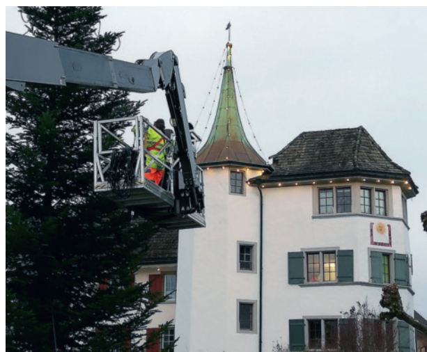
Montage Christbaumbeleuchtung beim Haus Hirzen.

auszusteigen. Der Nettoumsatz mit CHF 1.16 Mio ist rund TCHF 132 tiefer als im Vorjahr. Trotz des geringeren Umsatzes können wir mit TCHF 728 einen um TCHF 54 höheren Bruttogewinn ausweisen. Die Personalzusammensetzung sowie die Konzentration auf den Dienstleistungssektor ermöglicht einen sehr flexiblen und professionellen Kundenservice. Unsere Stärken liegen zudem beim flexiblen Einsatz des Personals. So ist sich niemand zu schade auch einmal bei Regenwetter bei Netzarbeiten im dreckigen Graben auszuhelfen.